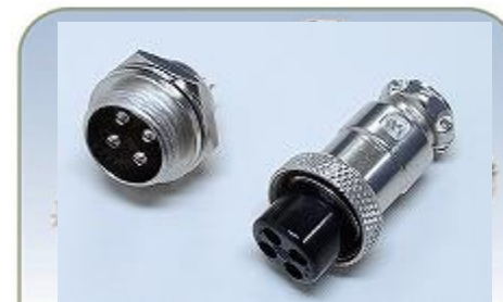
PLT- 16 Series