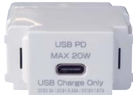
N-USB0401CW セラミックホワイト