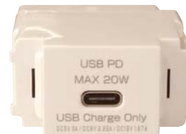
N-USB0401W ホワイト (受注生産品)